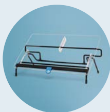
R-Go Flex Read